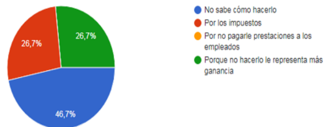
Ilustración 11 Razones para la no formalización de los negocios

El 46.7 % de los encuestados respondió que nunca ha tenido la oportunidad de conocer los beneficios de la formalización empresarial, por lo que se evidencia que deben implementar campañas donde se muestra las garantías, porque las divulgaciones de estos contenidos no están dando los resultados esperados respecto a las estrategias utilizadas por el gobierno para que se puedan llevar a cabo los proyectos o las ideas de negocio.