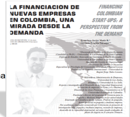
Matiz, Naranjo (2011) La financiación de nuevas empresas en Colombia, una mirada desde la demanda.