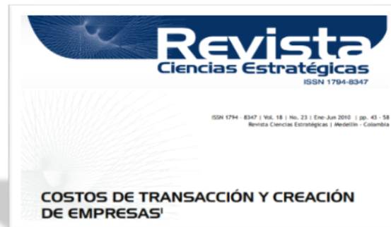
Ramírez Gómez (2010). Costos de transacción y creación de empresas.